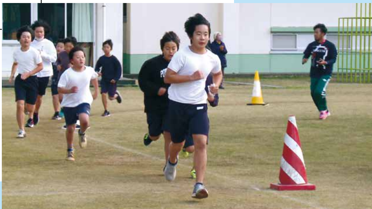
小学校持久走記録会

編集・発行 ■ 東京都神津島村 情報通信課 〒100-0601 東京都神津島村904番地 ☎04992 (8) 0011 / fax 04992 (8) 1242