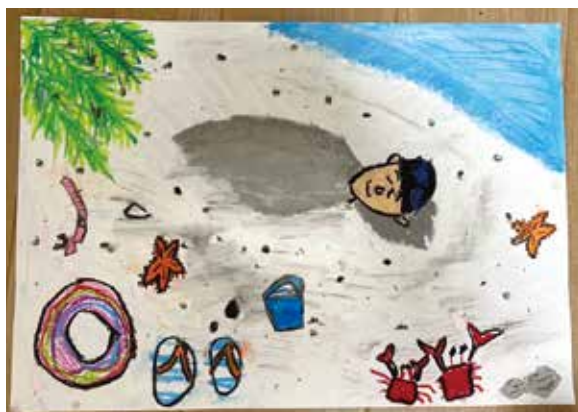
金賞に選ばれた絵