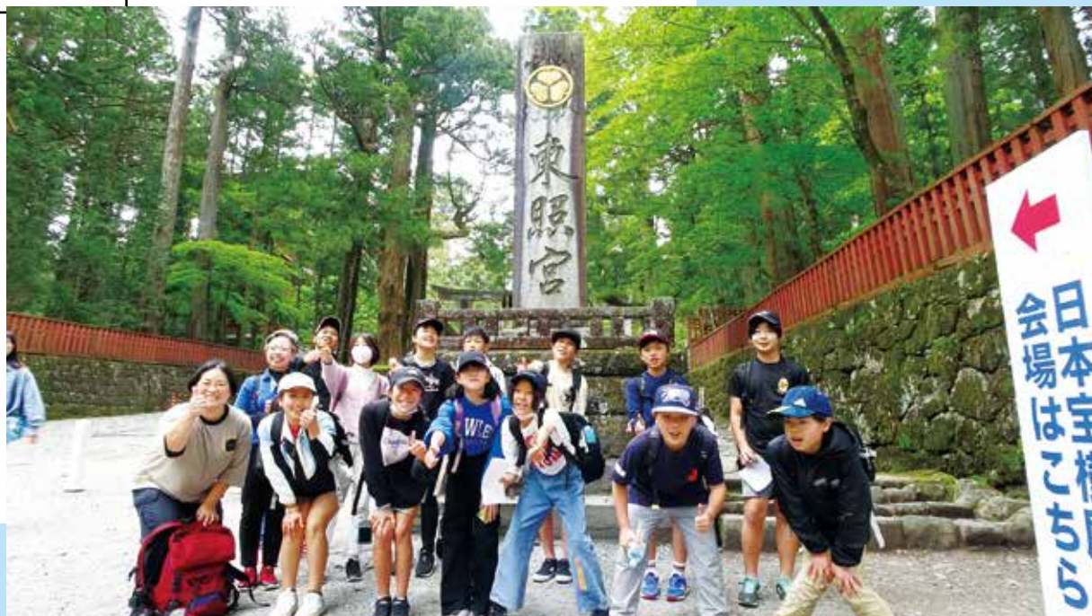
小学6年生日光移動教室

編集・発行 ■ 東京都神津島村 情報通信課 〒100-0601 東京都神津島村904番地 ☎04992 (8) 0011 / fax 04992 (8) 1242