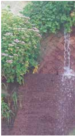
多幸湾湧水とアジサイ