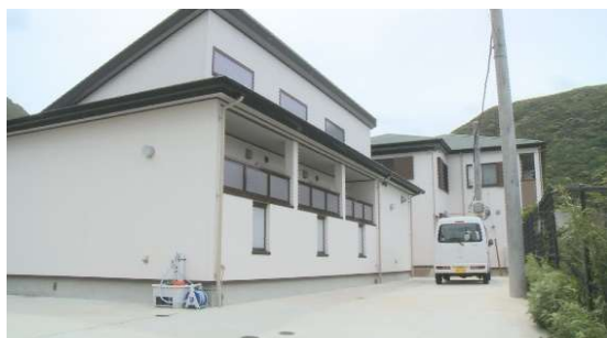
神津島村営しらすな学生寮