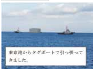
東京港からタグボートで引っ張って来ました。