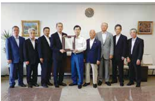
東京消防庁急患搬送8,000回に伴う 感謝状贈呈式 写真中央:安藤消防総監

今後とも、島民生活の安心・安全のため東京消防庁職員皆様のご活躍とご健勝を祈念致しております。 ありがとうございました。