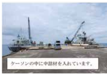
ケーソンの中に申請材を入れています。

設を行っております。今年度は、平成29年度に続きケーソン1函を設置し、防波堤の延伸工事を行っております。7月8日に東京港を出発し、えい航してきたケーソンの据付作業が7月10日に無事完了しました。本工事は、令和2年1月にしゅん功する予定です(計画延長305mのうち、90m完成)。今後、港湾事業へのご理解とご協力をいただきますよう、宜しくお願い致します。