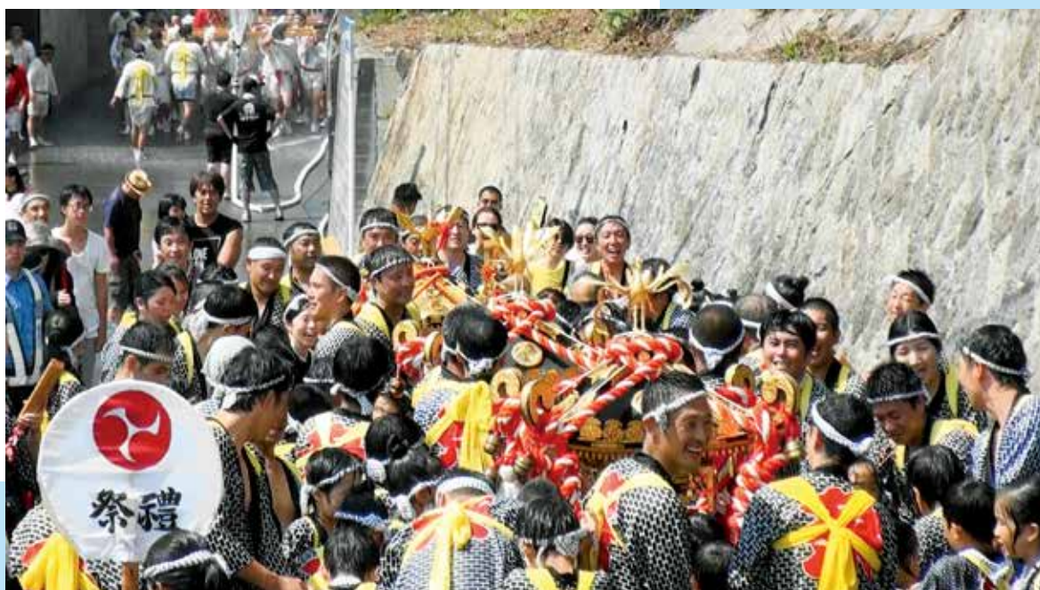
物忌奈命神社例大祭 神輿渡御