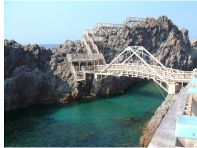
*美しい魚がたくさん！