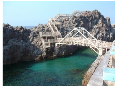
* 美しい魚がたくさん！